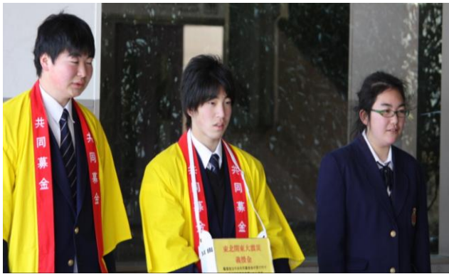
【大川学園の皆さま】