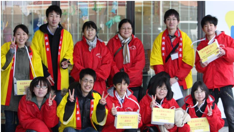
【駿河台大学の学生の皆さま】

皆さまよりお預かりした募金は、東日本大震災義援金として社会福祉法人中央共同募金会に送金されて被災地へ配分されます。募金にご協力頂いた多くの市民の皆さま、本当にありがとうございました！