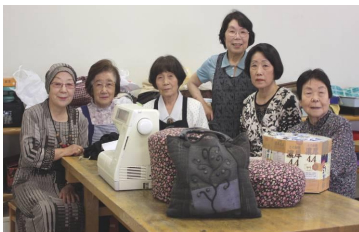
【「小物作りの会」の皆さん】

「ボランティア活動をしてみたいけど…」「どんな活動があるのか情報がほしい！」と考えている方はいらっしゃいませんか？ボランティアセンターではボランティアコーディネーターがその人にあった活動を一緒に考えて紹介します。ぜひ、飯能市ボランティアセンターへお気軽にお越しください！