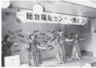
総合福祉センター発表会2022

事業所経営に大きく影響する特定事業所加算Ⅱを取得するため、各種算定要件を満たせるよう経営努力を重ね、介護保険事業収入のV字回復を達成しました。