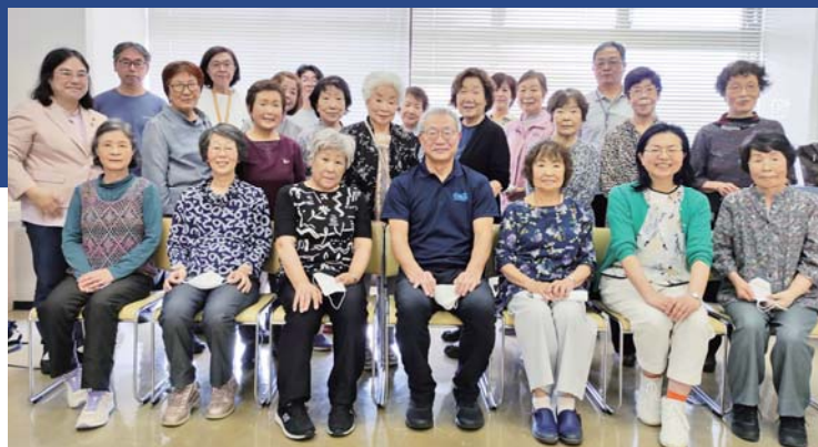
カーレット飯能集合！

居場所づくり」を目指したいと思い、令和4年10月に「カーレット飯能」を立ち上げ、毎週土曜日みんなで楽しく活動しています。