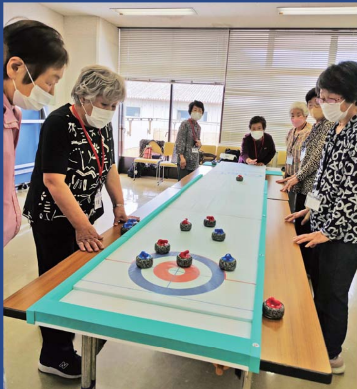
カーレットを行っている様子