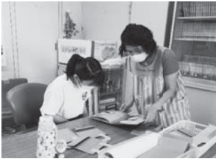
児童センターボランティア体験