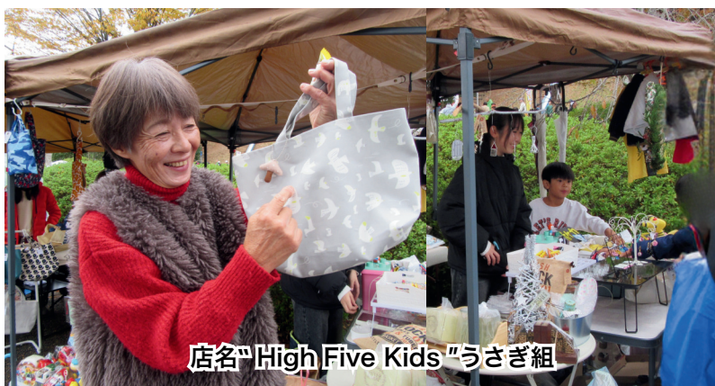
店名「High Five Kids」うさぎ組

店名は、「子どもたちが心がはずんだ時に『イエ ー!』とハイタッチをする手がモチーフになっ ています。